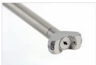
WERUCON®. lapos-sugarú fúvókák, a ködmentes kenéshez

A nagy pontosságú és aprólékos kenőanyag adagolás optimalizálja és mindig biztosítja a felhasználási folyamatot. A szalagkenéshez a lapos-sugarú fúvókák javasoltak, mert ez a típus garantálja az egyenletes, folyamatos biztos felhordását a kenőanyagoknak. Minden magas értékű fúvóka kb. 200mm szélességben fújja be a kívánt felületet. A fúvókák burkolatba való építése, védelme általában felesleges.