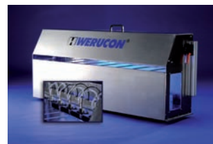
Átfolyó rendszerű kenőberendezés, optimális standard házzal

A DDS átfolyó rendszer, egy túlnyomásos rendszer. Az alaptípusú rögzítő konzol áll egy a kívánt számú szóró szelepekből, tartályból a kenőanyag vezetékekkel és a kapcsoló szekrényből.