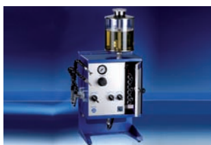
Mikro-adagoló automata MDA, teljesítmény erős pumpákkal

A WERUCON® Mikro-adagoló berendezések, kompakt és rugalmasan felhasználható egységei, precíz és erős teljesítményű tulajdonságokkal rendelkeznek. A volumetrikusan működő szivattyúk alkalmasak különböző kenőanyagok felhasználására.