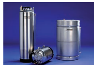
Kenőanyagtank, 10, 25 és 50 literes kivitelben